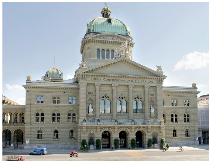
Eingang Bundesplatz für Gäste im Rollstuhl.