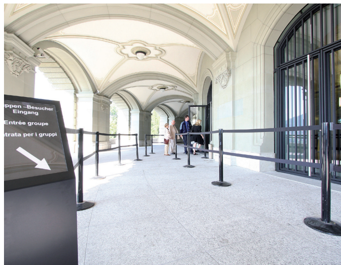
Eingang Bundesterrasse für Gäste.